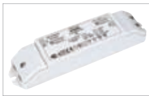
LED-Netzteil 60W [470542]