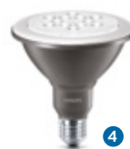
MASTER LEDpar 38 13 W