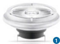
MASTER LEDspot AR111 11 W/15 W/20 W