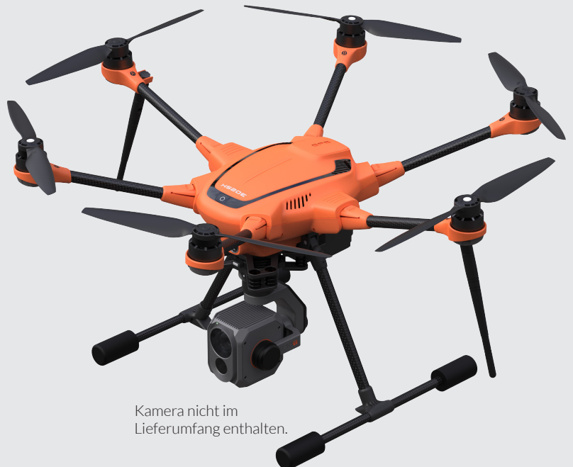
Kamera nicht im Lieferumfang enthalten.